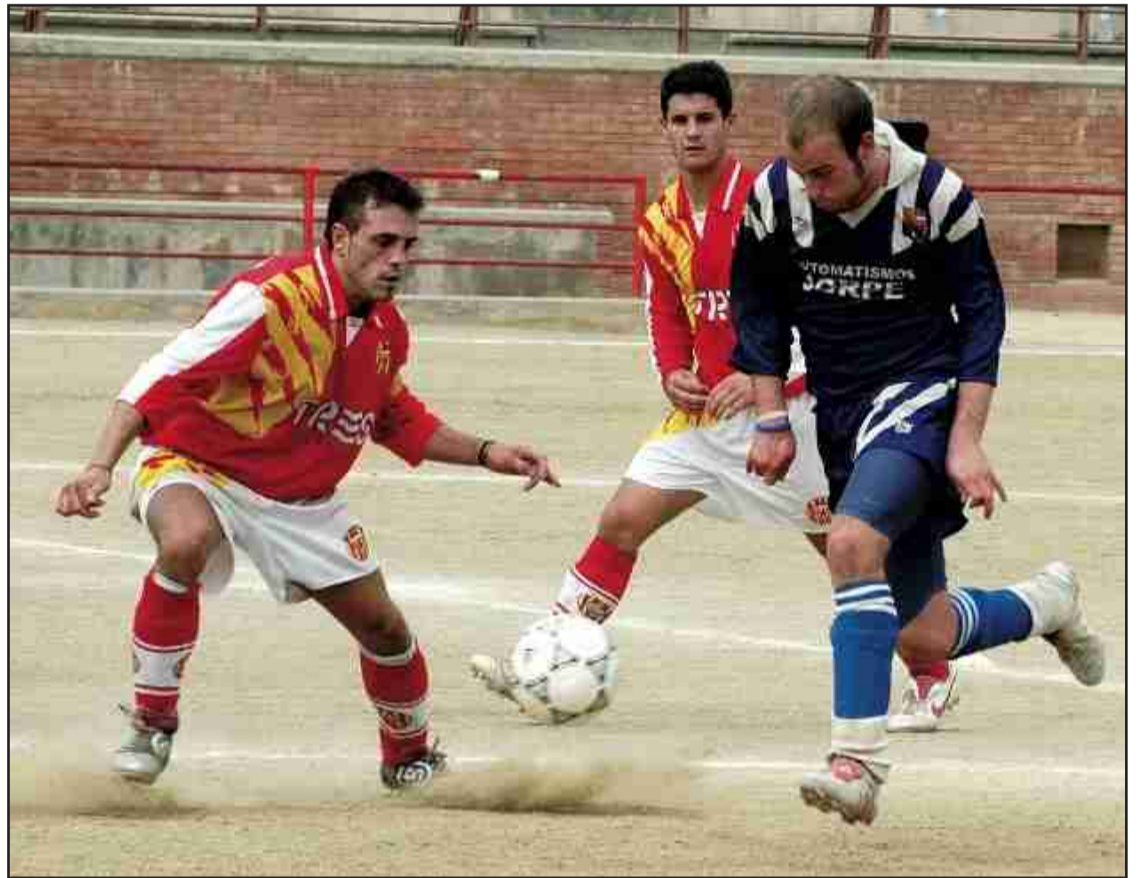
Els espluguins mantenen intactes les seves possibilitats de pujar a Regional Preferent