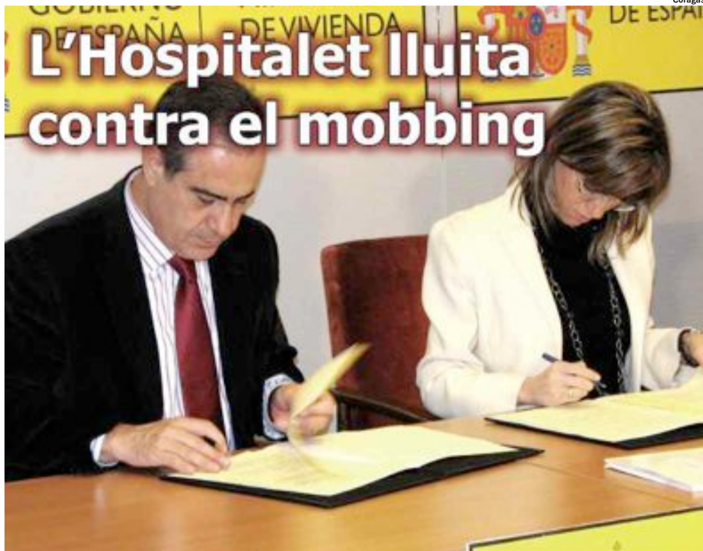
L'Ajuntament acaba de signar un conveni pilot amb el Ministeri d'Habitatge per combatre l'assetjament immobiliari. (pàg. 3)